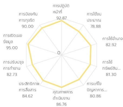
สรุปผลการประเมินรายตัวชี้วัด